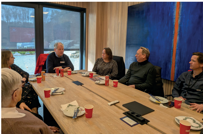
Besøk fra Stiftelsen Dam.